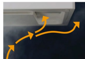
調理状況にあわない風量での運転時