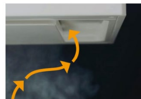
調理状況にあった風量での運転時